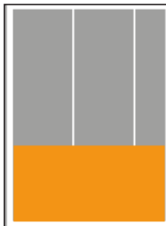
1/3 Seite quer B 190 x H 100 mm