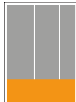
1/4 Seite quer B 190 x H 70 mm