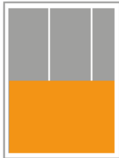
1/2 Seite quer B 125 x H 255 mm